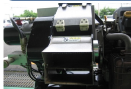
粉砕部はドラムタイプ使用

マイクロコンピューター搭載によりエンジン回転数、投入物の大きさを検出し供給速度を自動制御するので誰でも手軽に使用可能