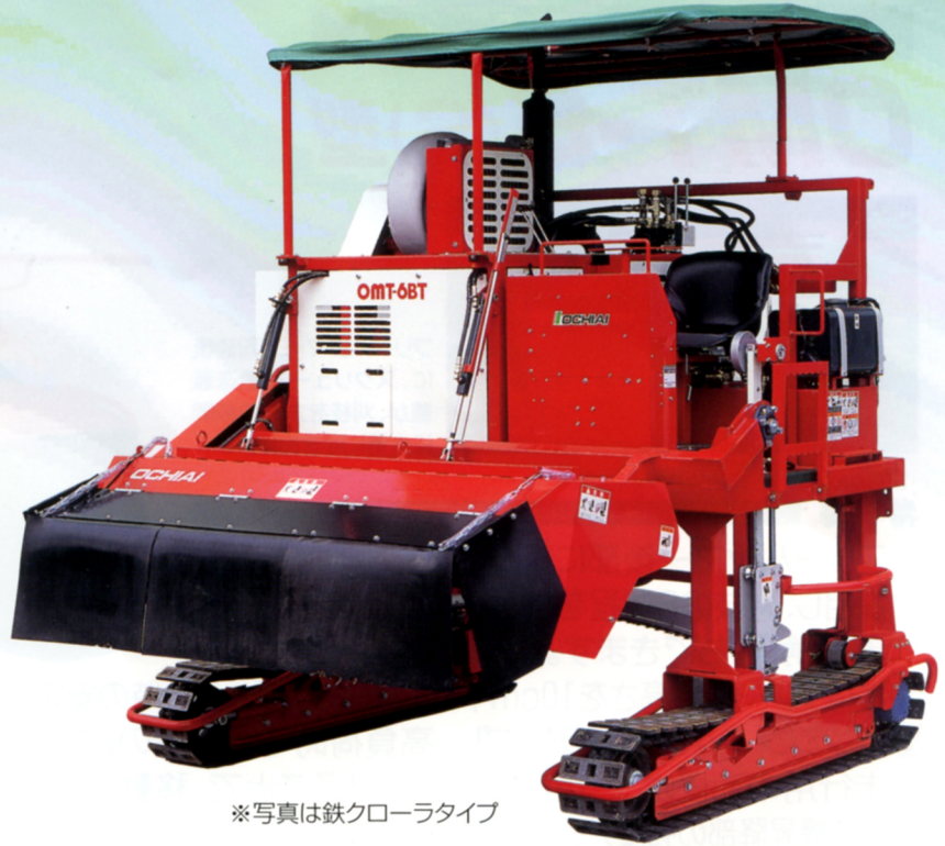
※写真は鉄クローラタイプ